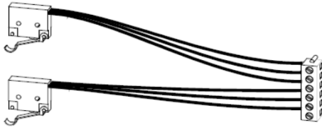
Zusatzwegschalter für PSL Mod. 3/PSQx02